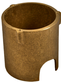
Hus for sensor

Huset er et installationsrør til TM-3356 samt dæksel til huset til at dække hullet under installation. Dækslet placeres i huset inden der kommer fx asfalt på - hus/dæksel skal bestilles separat.